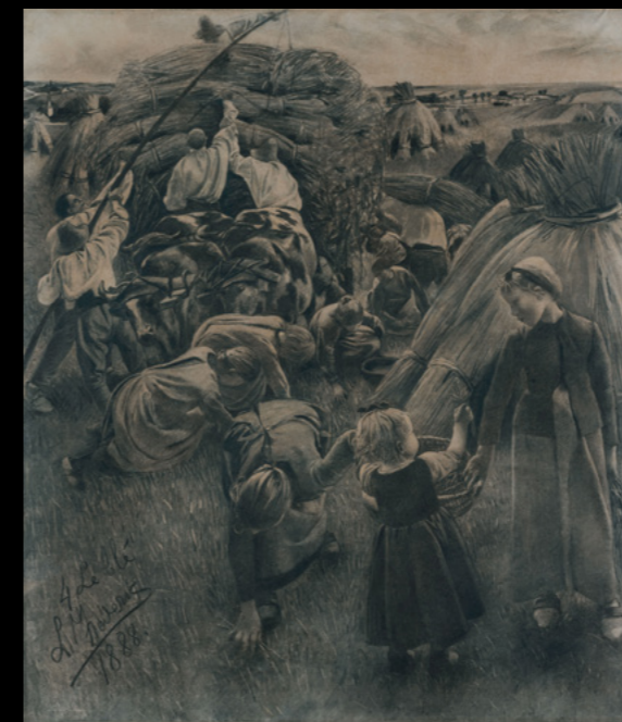
Le Blé IV - La Récolte Léon Henri Marie Frédéric, baron (1856 - 1940) 1888, fusain sur papier, 114 x 97,5 cm

L'exposition « L'invention du travail - L'agriculture au Néolithique » explore la naissance des premiers gestes agricoles en les mettant en regard avec leurs représentations plus récentes. Les musées conservent de nombreuses traces matérielles du travail à la fin de la Préhistoire, mais aucune image des sociétés néolithiques elles-mêmes. Pour combler cette absence, l'exposition s'appuie sur les œuvres du XIX e siècle, période où les artistes, influencés par le réalisme social et le naturalisme, observent avec précision la condition paysanne, la pénibilité du labeur et la dignité du travail de la terre.