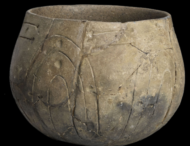
Vase en céramique à décor rubané Néolithique ancien