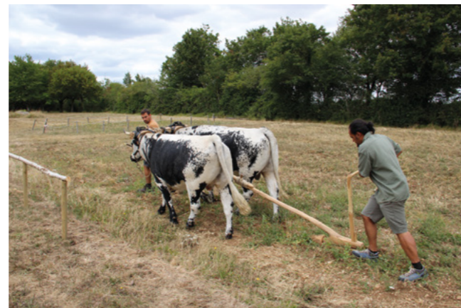
Expérience de traction animale d'une reproduction d'une araire néolithique