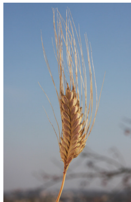
Blé Zanduri, Triticum timopheevii