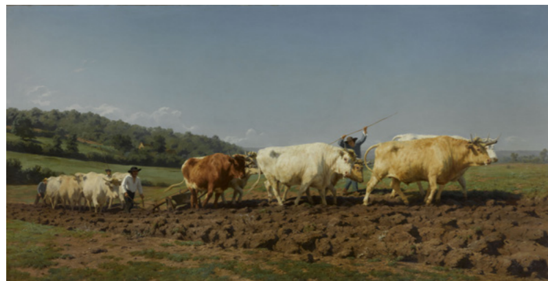
Labourage nivernais : le sombrage Rosa Bonheur (dit), Marie Rosalie Bonheur (1822 - 1899) 1849, huile sur toile, 133 x 260 cm

L'exposition « L'invention du travail - L'agriculture au Néolithique » explore cette rencontre féconde : comment les vestiges archéologiques racontent-ils les gestes originels de la sédentarisation ? Comment la peinture, la sculpture ou la gravure les réinventent-elles pour mieux les comprendre ? À travers ce jeu de reflets entre connaissances et représentations, le passé néolithique devient un terrain d'échange et de création.