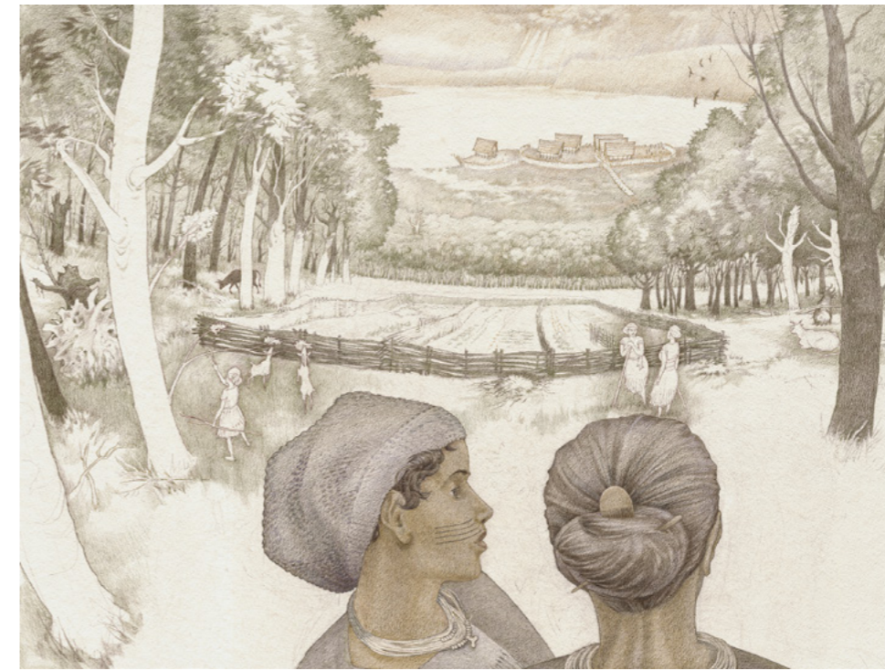
Défricher la forêt pour l'agriculture et l'élevage il y a 5 000 ans Pierre-Yves Videlier Années 2020 © P.-Y. Videlier, Atelier Scène de papier